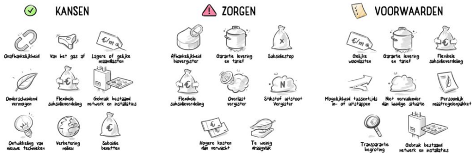
De 'praatplaat' waarin de resultaten van de bewonersavonden zijn weergegeven